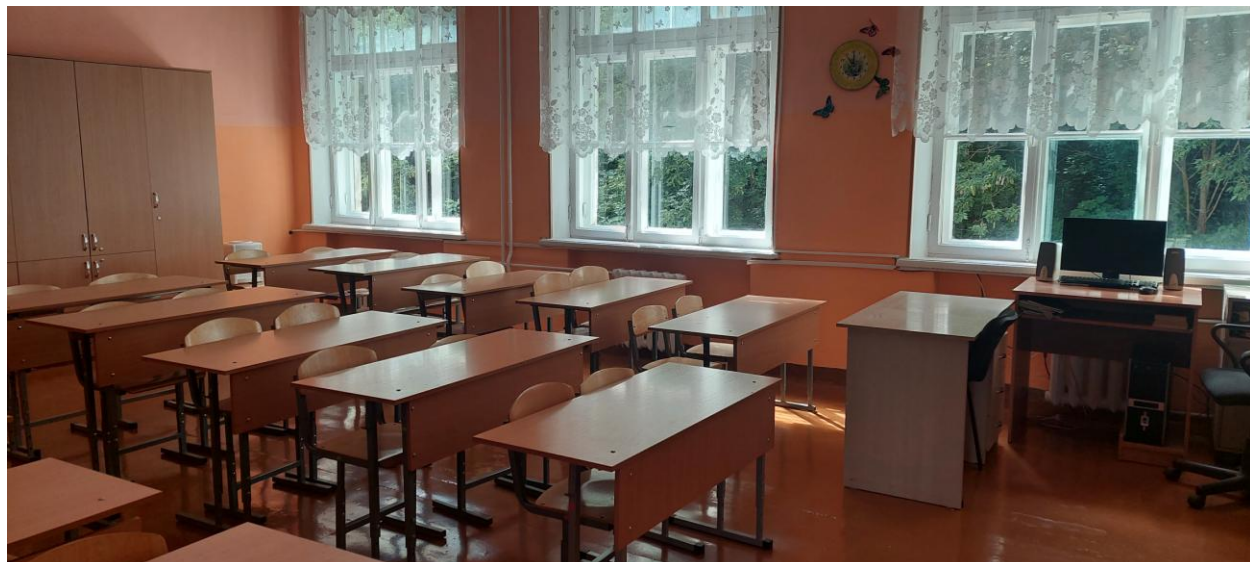
Таблица 1. Внешний вид кабинета

Ф.И.О. заведующего кабинетом – Филяева Ольга Анатольевна Функциональный тип кабинета - кабинет начальных классов Ф.И.О. учителей, работающих в кабинете – Филяева Ольга Анатольевна Площадь кабинет - 45,8 м 2 Число посадочных мест – 30