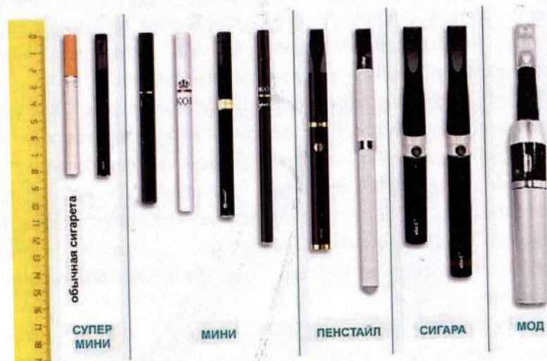
Рис.4. Типы и размеры электронных сигарет

Электронные сигареты (вейпы) классифицируются также по типу и размеру (рис.4) в соответствии с длиной (от 82 мм до 175 мм).