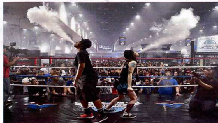
Рис. 2. Вейпинг соревнование

Быстрому распространению курения ЭС (вейпингу) способствуют компании-производители, которые превратили курение ЭС в целую субкультуру. В мире на регулярной основе проводятся субсидируемые компаниями-производителями выставки и соревнования среди курильщиков ЭС (рис.2). Это так называемые: «Cloudchasing» (мастерство выдувания облаков пара), «Tricks» (трюки с паром) и «Вейпинг-алхимия» (соревнования по составлению новых жидкостей для вейпа).