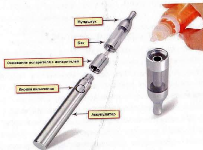
Рис. 3. Устройство электронной сигареты

Обычная электронная сигарета состоит из аккумулятора, электрического испарителя, емкости для жидкости, мундштука и дополнительных элементов для автоматического управления подачей ароматизированной жидкости (но последние имеются не во всех моделях), рис.3.