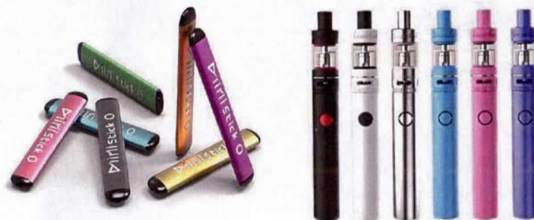
Рис. 5. Одноразовые (слева) и многообразные (справа) электронные сигареты

Одноразовые ЭС рассчитаны на 200 - 500 затяжек пара. В многообразных устройствах нет таких ограничений и они работают до тех пор, пока доливается жидкость в емкость.