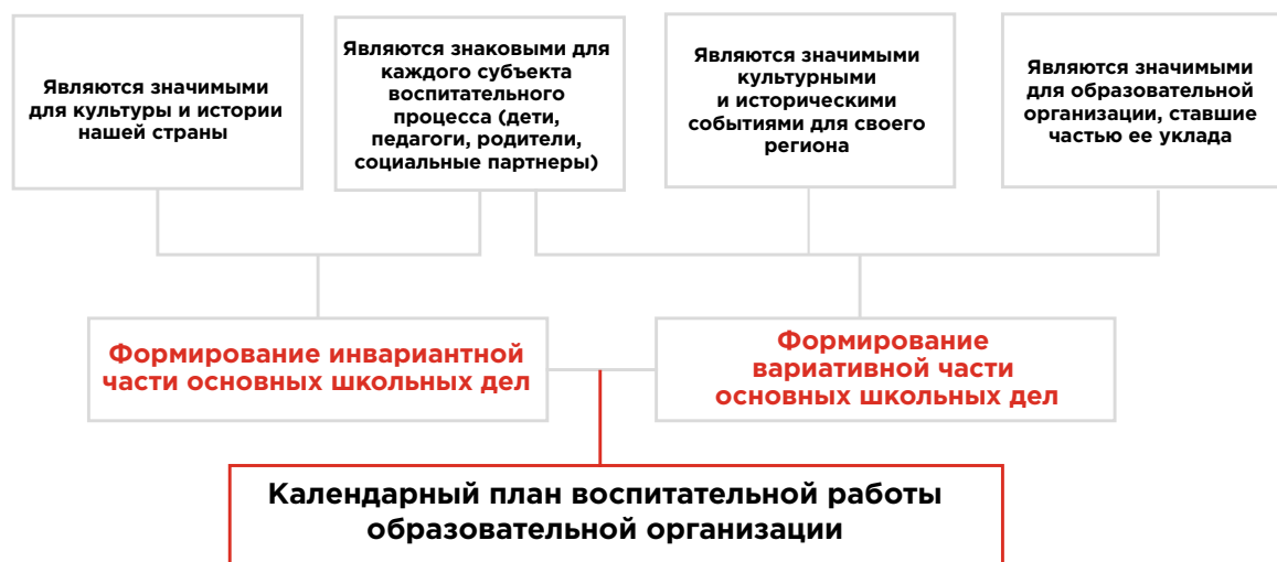
Рисунок 1 — Схема отбора событий для включения в модуль «Основные школьные дела»

Из примерного календаря воспитательной работы, перечня значимых дат региона и уклада образовательной организации выделите события, которые